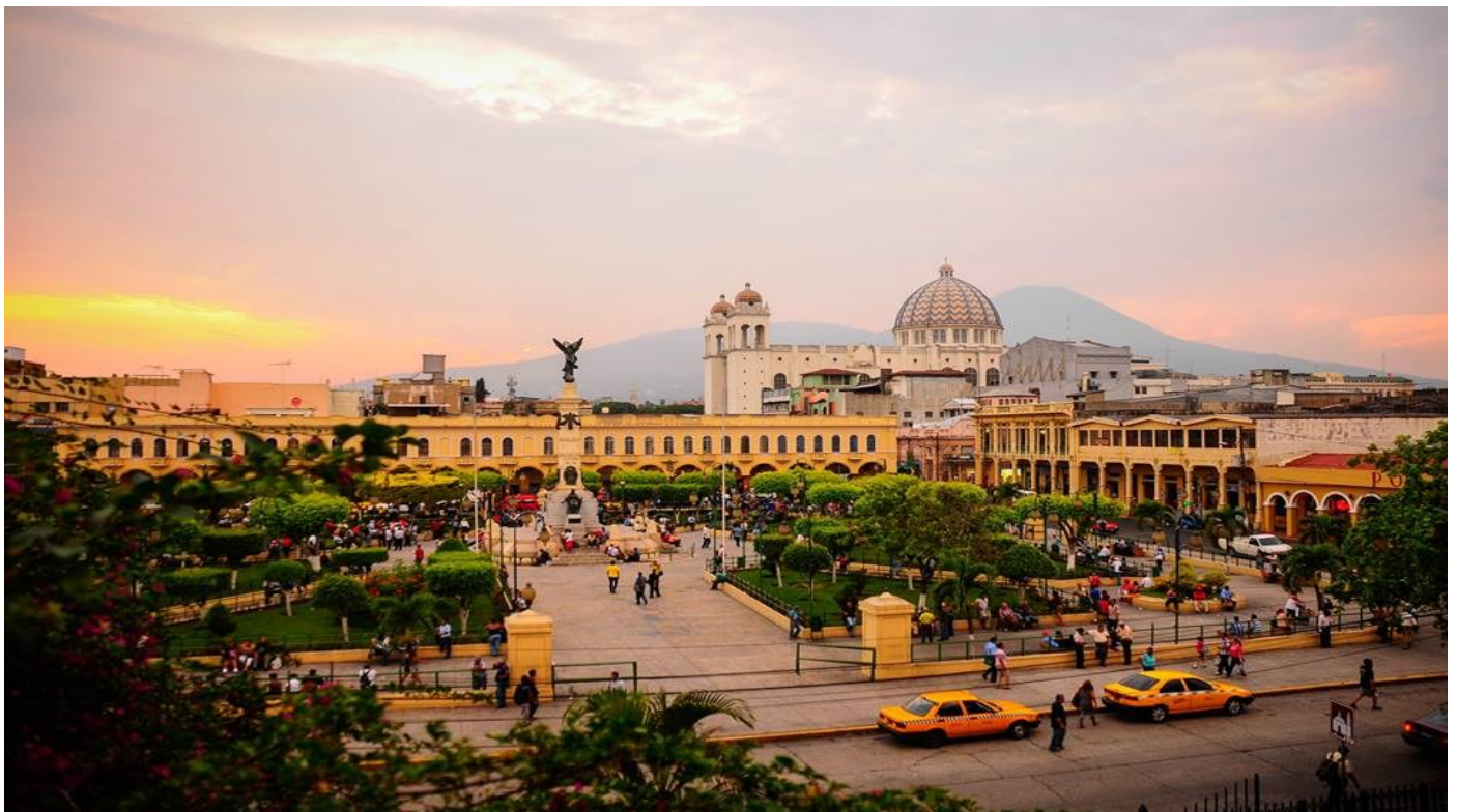
CENTRO DE SAN SALVADOR, PARQUE LIBERTAD