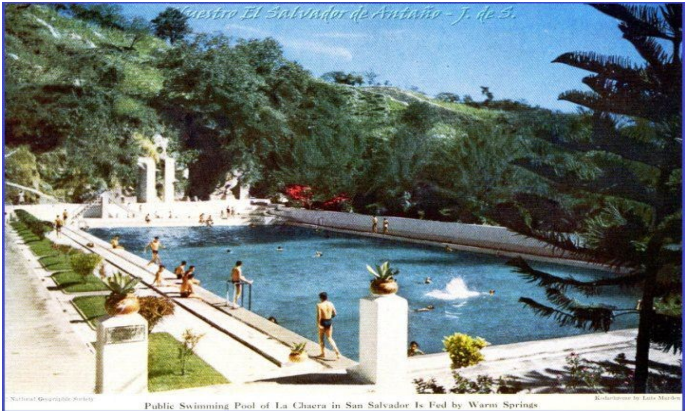
LA PISCINA DE "LA CHACRA" Y SUS TIBIAS AGUAS