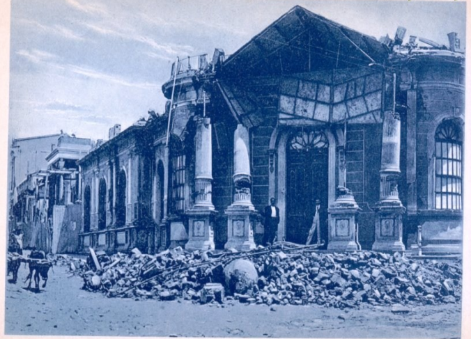
Logia Masónica, destruida por el terremoto. 7 de Junio 1917 San Salvador View of a house destroyed by earthquake. 7th of June 1917