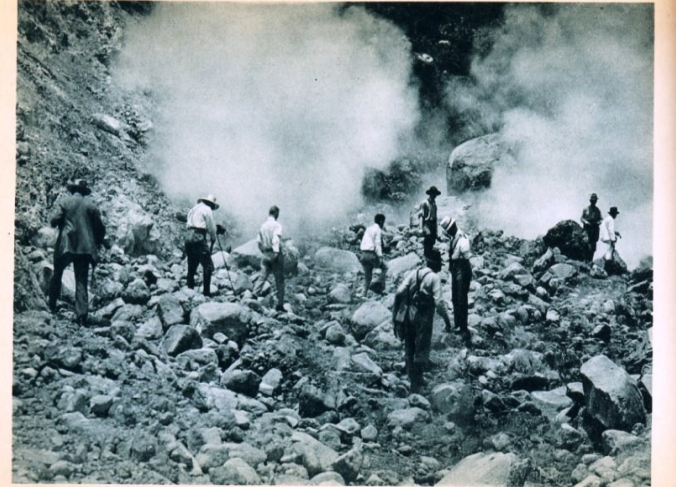
Excursionistas á los infernillos de S. Vicente Excursion to the hot sulphur springs on the Volcano of S. Vicente