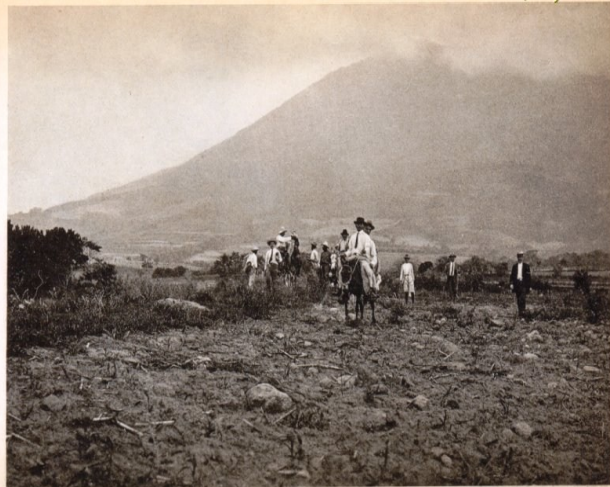
Excursión al Volcán S. Vicente Dep. S. Vicente Excursion to the Volcano S. Vicente