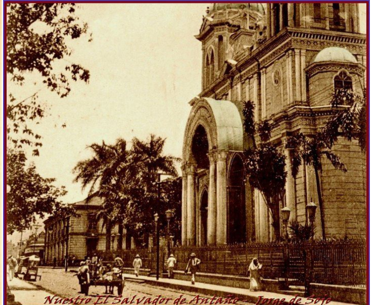
Nuestro El Salvador de Antaño - Jorge de Sojo