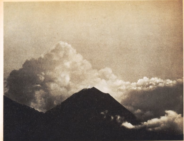
Volcán de Izalco. Dep. Sonsonate Izalco-Volcano. «El Faro de El Salvador» «The Lighthouse of El Salvador»