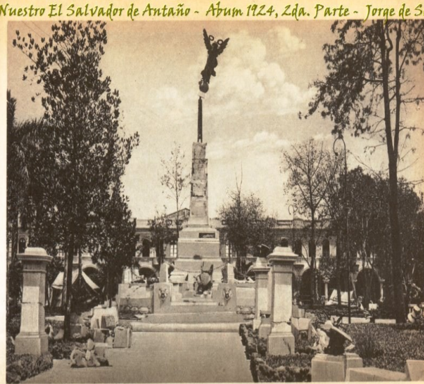
Monumento de La Libertad destruido San Salvador Liberty Monument destroyed