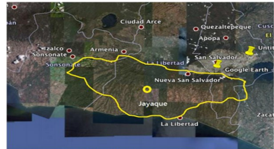
Cfr. David Browning, Op. Cit. , págs.25-26. ● Ubicación de Jayaque en la cordillera.