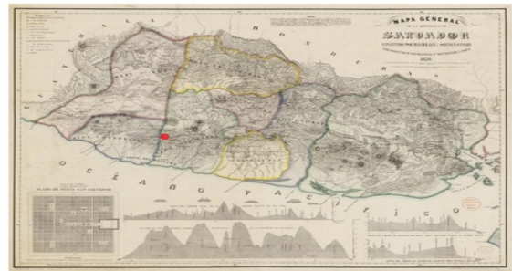
Ubicación espacial de Jayaque en el mapa.

Años después, en 1861, un informe municipal describe al único asentamiento de Jayaque, "sobre una loma plana que comienza al pie de la montaña llamada la cumbre" distante a muy pocos metros hacia el sur 111. En realidad lo que el informe describió era la ubicación en la que se consolidaría la actual área urbana del municipio que está situada a 990 MSNM. El siguiente mapa hecho en 1859 a pesar de sus limitantes, brinda una idea de la ubicación geográfica de Jayaque coincidiendo con la apreciación municipal: