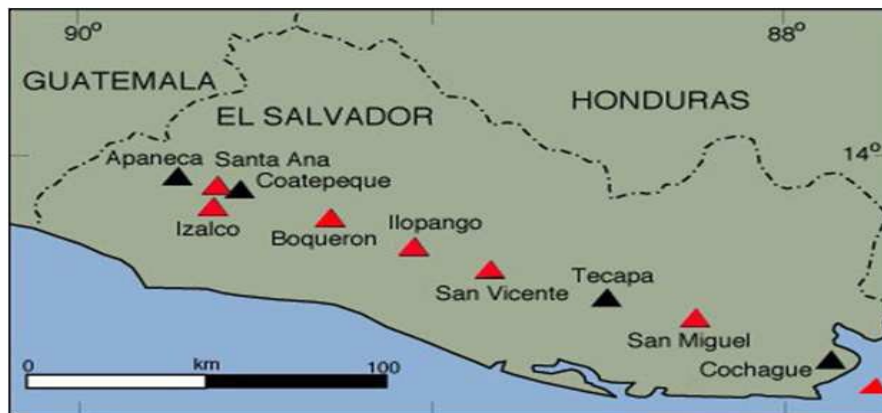
Figura A 2. Mapa de distribución de volcanes en El Salvador